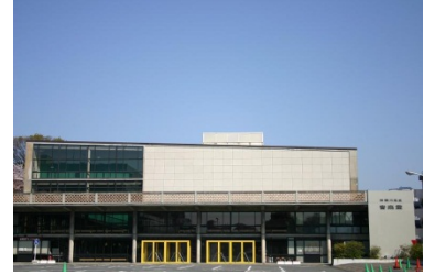
神奈川県立音楽堂

※次頁以降の凡例（ 公1 、 収1 、 収2 、および 法人 ）は、公益認定および会計上の分類を示す。