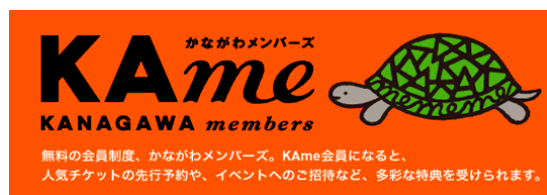
「かながわメンバーズ」