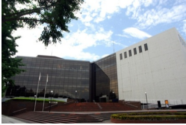
神奈川県民ホール